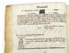
2.4 Strumento dotale, c. 2v 1776 febbraio 16, Bergamo ASBg, Atti dei notai , b. 8890