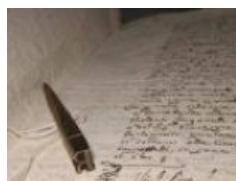
3.5 Decreto per la nobile contessa Elena Rivola, particolare 1785 maggio 31, Bergamo Particolare del tipario con la lettera "R" utilizzato per contrassegnare la neonata. ASBg, Atti dei notai , b. 12607