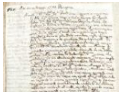
3.2 Decreto per la nobile contessa Elena Rivola, c. 1r 1785 maggio 31, Bergamo ASBg, fondo Archivio notarile , Atti dei notai , b. 12607