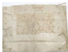
1.1 Lettera del doge a Tisbe Martinengo 1467 novembre 23, Venezia Missiva circa la salvaguardia dei beni e la conservazione di stima e amicizia nei confronti di Bartolomeo Colleoni. ASBg, Martinengo Colleoni , 6