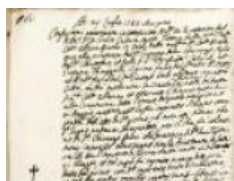
3.6 Relazione di verifica 1785 luglio 29, Bergamo Relazione del notaio Longaretti sulla impressione di un nuovo marchio a distanza di due mesi. ASBg, Atti dei notai , b. 12607