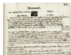
2.3 Strumento dotale, c. 2r 1776 febbraio 16, Bergamo ASBg, Atti dei notai , b. 8890