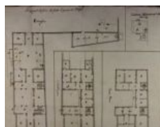
notarile 8888 Ponte Ranica, località Rosciano, 1724 febbraio 16, Fancesco Pasta