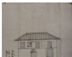
notarile 8245 Ponteranica, località Ponte Secco, [1737], Ambrogio Bottani