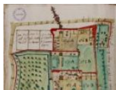
notarile 6981 Pedrengo, mappetta, 1747 aprile 14, Carlo Bartolomeo Gismondi

Nella didascalia delle immagini sono indicati: luogo (è indicata la provincia in caso diverso da quella di Bergamo), data (anno mese e giorno) e autore del disegno. Le attribuzioni sono fra [].