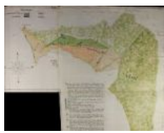
notarile 12532 Gandino, [marzo 1774], Giovanni Piantoni "perito agrimensone collegiato"

Archivio di Stato di Bergamo Indirizzo: Via Bronzetti 24 - 24124 Bergamo Tel: 035-233131 Direttore: Dott.ssa Lucia Citerio e-mail: as-bg@cultura.gov.it Posta Elettronica Certificata: as-bg@pec.cultura.gov.it