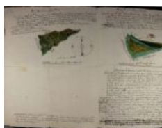
notarile 8317 Adrara, località Piazza, 1757 novembre 8, Francesco Angelini, "agrimensore pubblico"