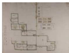
notarile 9056 Alzano Maggiore, [1776]