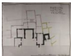
notarile 10947 Spirano, [1792], Gerolamo Salvatore Lucchini