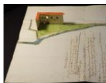
Mappa S Bartolomeo 4