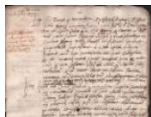
Notarile 3956 3