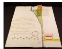
Mappa S Bartolomeo 5