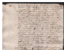
Notarile 3956 2