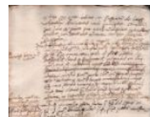
Notarile 3956 5