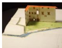
Mappa S Bartolomeo 3