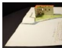
Mappa S Bartolomeo 2