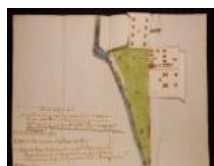
Mappa S Bartolomeo 1