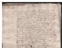
Notarile 3956 1